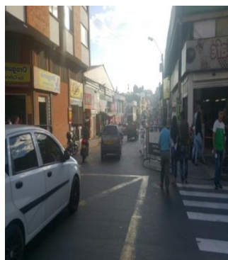
Calle 18 entre carreras 18 y 19

R-AM-SGI-001 Versión 01 Fecha: 02/01/2017