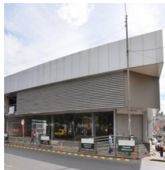
Carrera 18 entre 16 y 17